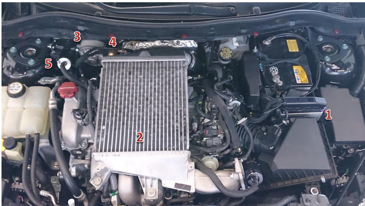
1-sterownik/ECU Zenit Direct, 2-wtryskiwacze gazu/gas injectors, 3-reduktor/reducer, 4-elektrozawór z filtrem fazy ciekłej/electrovalve with liquid gas phase filter, 5-filtr fazy lotnej/gas phase filter