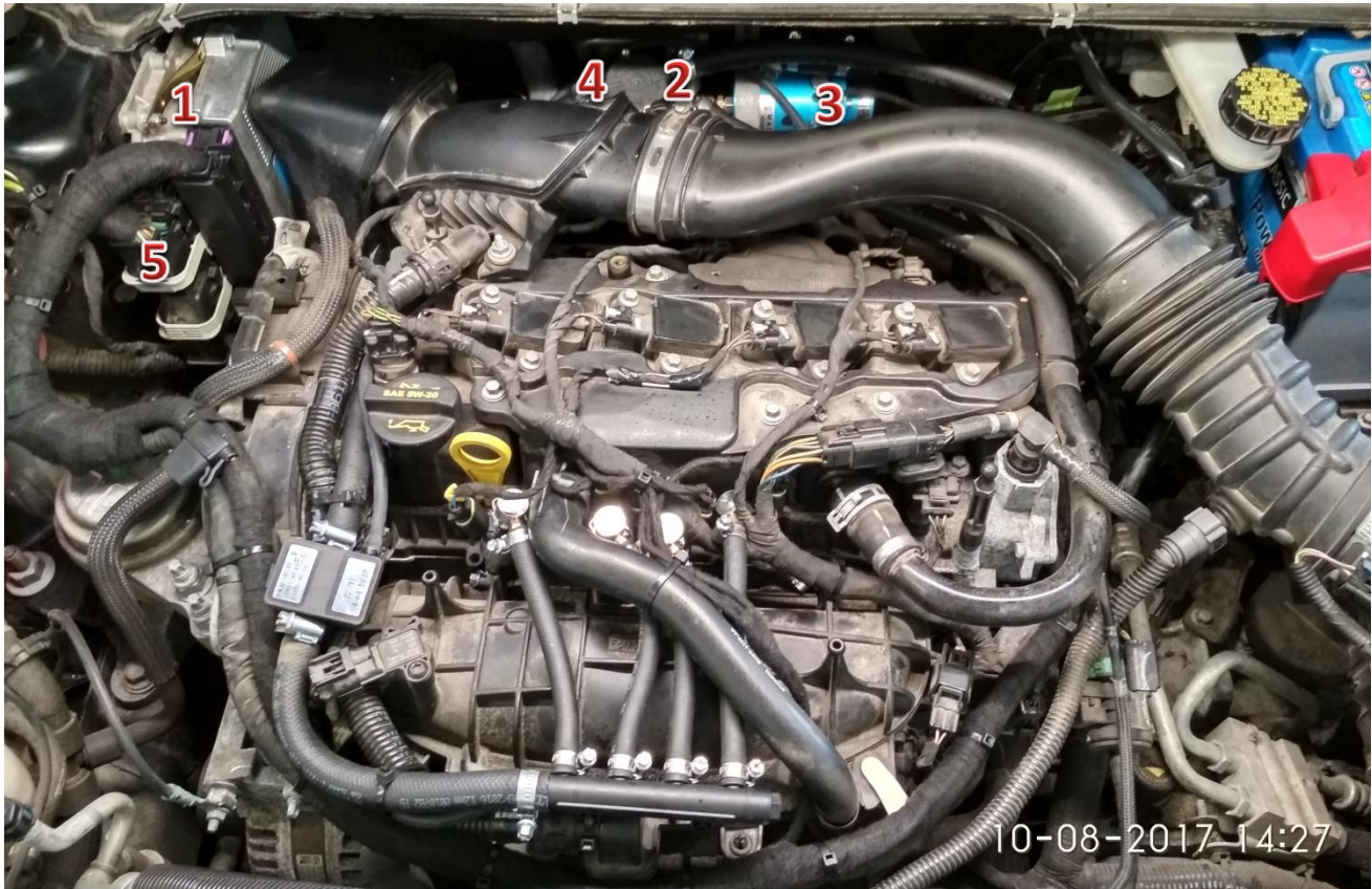
1-sterownik/ECU Zenit Direct, 2-wtryskiwacze gazu/gas injectors, 3-reduktor/reducer, 4-filtr fazy lotnej/gas phase filter, 5-elektrozawór z filtrem fazy ciekłej/electrovalve with liquid gas phase filter