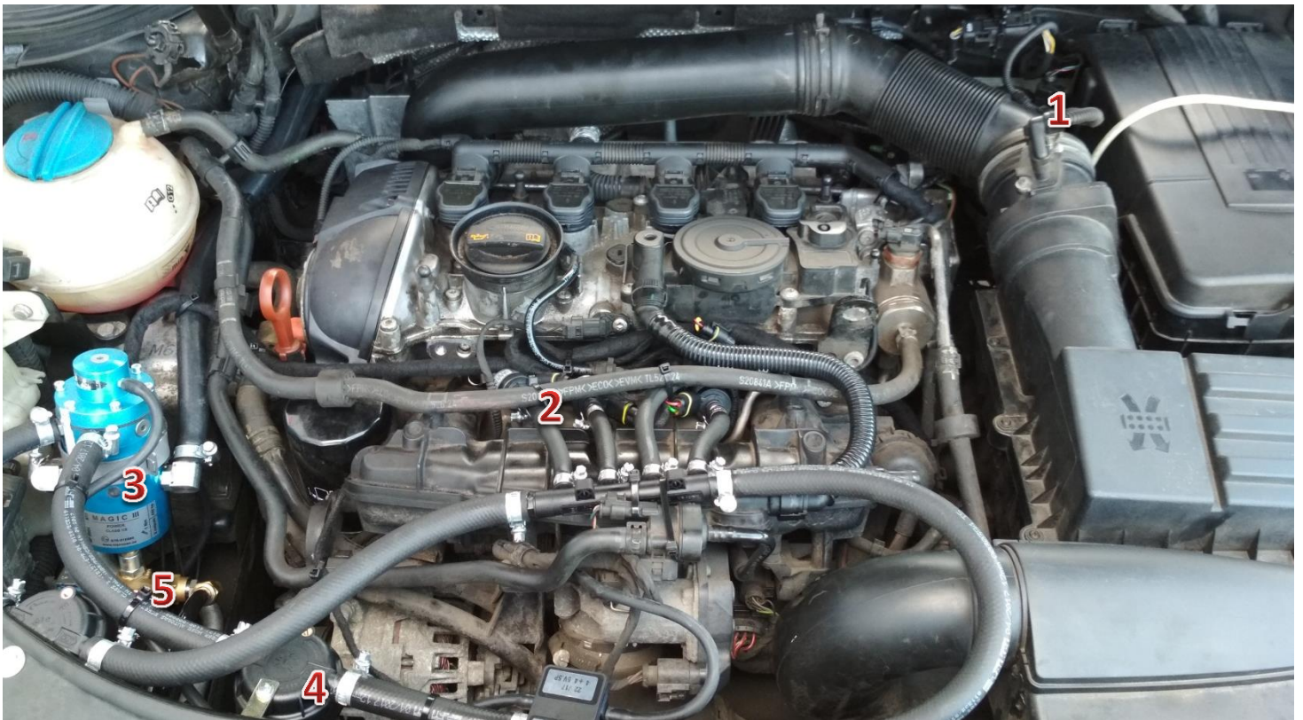
1-sterownik/ECU Zenit Direct, 2-wtryskiwacze gazu/gas injectors, 3-reduktor/reducer, 4-filtr fazy lotnej/gas phase filter, 5-elektrozawór z filtrem fazy ciekłej/electrovalve with liquid gas phase filter