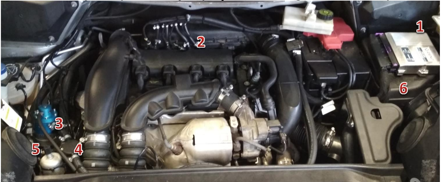
1-sterownik/ECU Zenit Direct 2-wtryskiwacze gazu/gas injectors, 3-reduktor/reducer, 4-filtr fazy lotnej/gas phase filter, 5-elektrozawór z filtrem fazy ciekłej/electrovalve with liquid gas phase filter, 6 - petrol ECU